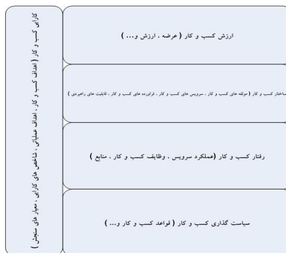
شکل ۴: مدل لایه‌ای رهیافت پیشنهادی

پنج عنصر تاثیرگذار در مدلسازی پیشنهادی کسب‌وکار سرویس‌گرای این مقاله، در قالب چارچوب معماری لایه‌ای شکل ۴ نمایش داده شده‌اند. این پنج عنصر کلیدی ارزش کسب‌وکار، ساختار کسب‌وکار، سیاست‌گذاری کسب‌وکار، کارایی کسب‌وکار و رفتار کسب‌وکار می‌باشند.